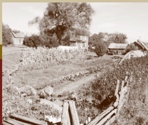
Alain Parent, Ruralys

Comment gère-t-on cette ressource? Qui sont les intervenants et quels sont leurs rôles? Comment procède-t-on? Quelles interventions devons-nous privilégier? Comment mobiliser une communauté dans une démarche de protection et de mise en valeur des paysages? Comment concilier la qualité paysagère avec l'occupation et l'exploitation du territoire?