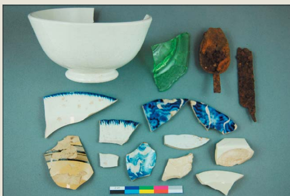
Quelques objets reliés à de la vaisselle de table (bols, assiettes et ustensiles)

Le mur de façade de la première maison a été dégagé et nous avons pu mieux comprendre son mode de construction. Son coin sud-ouest a été trouvé et nous avons pu constater que le mur de façade actuel reposait partiellement sur l’ancienne fondation. Plusieurs artefacts ont été récoltés, enrichissant ainsi la collection de la maison Louis-Bertrand comportant plus de 1154 objets récoltés. Les données recueillies de même que la collection archéologique riche et variée accroissent le potentiel de recherche et de mise en valeur. Nous espérons que ces nouvelles informations pourront servir à des fins pédagogiques et à des activités d’interprétation dans ce lieu patrimonial.