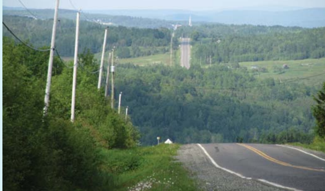
Paysage de collines à Saint-Elzéar-de-Témiscouata, Ruralys, 2011

De plus, une étude de potentiel archéologique a été effectuée dans les limites du futur parc afin d'évaluer son impact sur les ressources archéologiques potentielles. Le dépôt de l'étude d'impact au promoteur Boralex était prévu cet automne. À suivre!