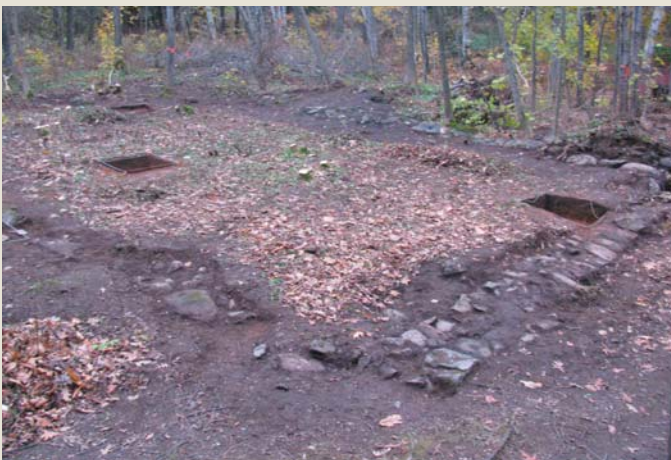
Fondations d'une dépendance à l'arrière du manoir

Dans le cadre du projet d'implantation d'un pavillon d'accueil à la Seigneurie des Aulnaies à Saint-Roch-des-Aulnaies, les archéologues ont réalisé un inventaire archéologique cet automne. Préalablement, une étude de potentiel archéologique démontrait qu'il pouvait y avoir des traces d'une occupation amérindienne préhistorique et bien sûr historique du lieu, puisque nous sommes sur un site occupé à partir du XVIII e siècle. Rappelons aussi que le site de la Seigneurie possède deux bâtiments classés monuments historiques par le gouvernement du Québec : le manoir et le moulin. Plusieurs sondages ont été réalisés dans le stationnement à l'arrière du moulin où sera situé le futur pavillon, ainsi que le long de la rivière Le Bras. Les sondages ont révélé que d'importants travaux d'aménagement ont perturbé les sols à ces endroits. Un autre lieu a été investigué par les archéologues, soit à l'arrière du manoir, là où un bâtiment de service sera construit. Des fondations d'un ancien bâtiment ont été dégagées.