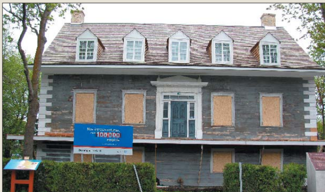
La maison Louis-Bertrand en cours de restauration en juin 2011

La fondation de la première maison, construite en 1818, avait alors été découverte de même que plusieurs objets reliés à l’histoire du site. Lors des travaux pour la pose des poteaux de la galerie, nous avons donc été présents pour recueillir le plus d’information possible sur l’histoire de ce site avant que les travaux détruisent les vestiges architecturaux.