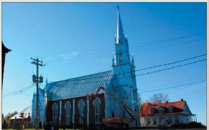
L'église de Leclercville (paroisse de Saint-Émmélie) construite en 1863 et son ancien presbytère

Des travaux de réaménagement de la route 132 et de réfection du réseau de traitement des eaux usées sont prévus dans la municipalité de Leclercville dans Lotbinière. Le ministère des Transports a mandaté Ruralys pour connaître le potentiel archéologique de la municipalité dans les limites des futurs travaux. Certaines zones identifiées ont pu accueillir des populations amérindiennes à partir de 8500 ans avant aujourd'hui. Faisant partie de la seigneurie de Lotbinière, concédée au milieu du XVII e siècle, Leclercville a été colonisée à partir du début du XVIII e siècle. L'identification des zones à potentiel archéologique permettront de planifier la vérification sur le terrain par des sondages. Il s'agit donc d'un processus de planification et de prévention avant les travaux majeurs prévus dans cette municipalité.