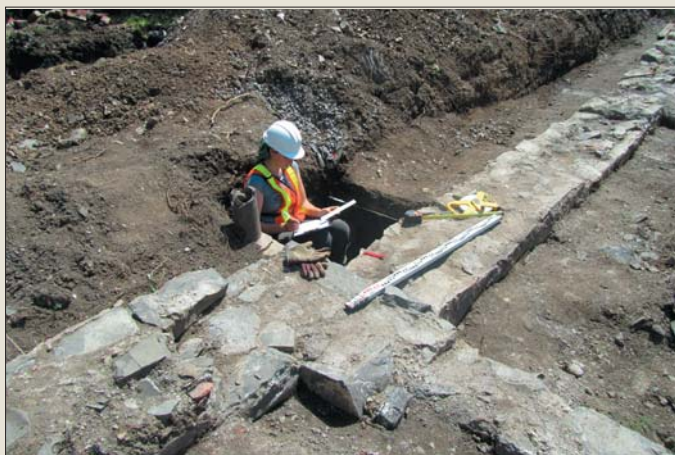
Dessin d'un mur dégagé de la villa Battlefield Cottage

Un inventaire archéologique a été réalisé sur le site du couvent Saint-Dominique situé sur la Grande-Allée, précisément dans le préau du couvent. Les fondations de la villa Battlefield Cottage , construite en 1829, ont été presque entièrement dégagées. Les archéologues ont récolté des informations sur le mode de construction de cette villa, de son corps de logis et d'un agrandissement comportant des éléments architecturaux particuliers tels qu'une galerie et une verrière. De nombreux artefacts ont été récoltés sur l'ensemble du site.