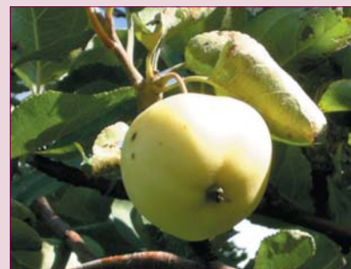
Pomme Jaune transparente