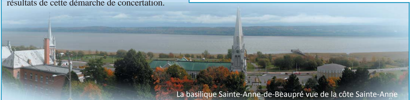
La basilique Sainte-Anne-de-Beaupré vue de la côte Sainte-Anne

Les petits patrimoines font l'objet d'un projet qui a été soumis à la CRÉ du Bas-Saint-Laurent et ses partenaires dans le cadre d'une Entente ciblée pour le développement de la culture au Bas-Saint-Laurent. Le projet consiste en la réalisation d'un site Web et d'un dépliant. Il vise à mettre en valeur les petits patrimoines restaurés du Kamouraska et d'en faire la promotion touristique par la création de circuits. Circuits thématiques, informations, documents de références et photos permettront de mieux faire connaître ces dépendances et ornements des paysages. Les petits patrimoines ont fait l'objet de plusieurs initiatives de Ruralys, et ce, depuis 2005 (inventaire, conception d'un programme d'aide à la restauration et à la mise en valeur). Le programme d'aide à la restauration des petits patrimoines en place depuis trois ans et géré par la MRC de Kamouraska est un grand succès. Notre projet vise à faire connaître cette initiative, à mettre en valeur les bâtiments restaurés et le travail des propriétaires. Vous pourrez en apprendre davantage à partir du Web et du dépliant qui seront disponibles au printemps 2012, et ainsi choisir des circuits pour découvrir ces petits patrimoines, mais aussi découvrir des paysages, des lieux et apprécier les restaurations.