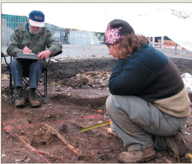
Dessin de la sépulture découverte en face du pavillon Baillargé

Les découvertes d'une sépulture et des vestiges associés à la redoute Wolfe sont majeures puisque faisant partie d'une période charnière dans l'histoire de la ville de Québec, mais également de la Nouvelle-France!