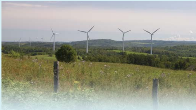
Éoliennes dans la région de Matane, Ruralys, 2008